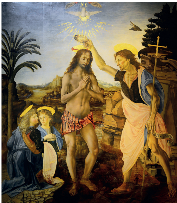
Bautismo de Jesús, Verrocchio y Leonardo da Vinci Galería de los Uffizi

El Equipo de Catequistas de Pre-bautismales lo constituimos dos matrimonios que se encargan de dar una formación básica del Sacramento del Bautismo, a los padres que quieren bautizar a sus hijos pequeños. Por el Bautismo nos introducimos en la Iglesia, en la Fe de Cristo y nos abre la puerta a recibir otros Sacramentos. Todo es un camino de salvación al que Dios nos llama. Lo que Dios quiere para nosotros es que estemos siempre con Él.