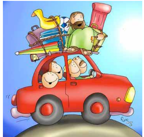
Ilustración de Fano

Ya llegó el verano más esperado de los últimos tiempos. Se levantan las restricciones, parece que la pandemia de COVID empieza a estar controlada, mucha gente está ya vacunada, por lo menos de la primera dosis, y hay unas ganas enormes de “salir”, de salir del miedo, de salir de casa... y también, por qué no, de salir con la familia. Ganas de volver al encuentro personal, aprovechando el verano, que es tiempo de relax y de vacaciones y de estar con la familia, pero ¡cuidado! Las vacaciones también se pueden convertir en un tiempo de estrés, de tensiones, de peleas y mal ambiente.