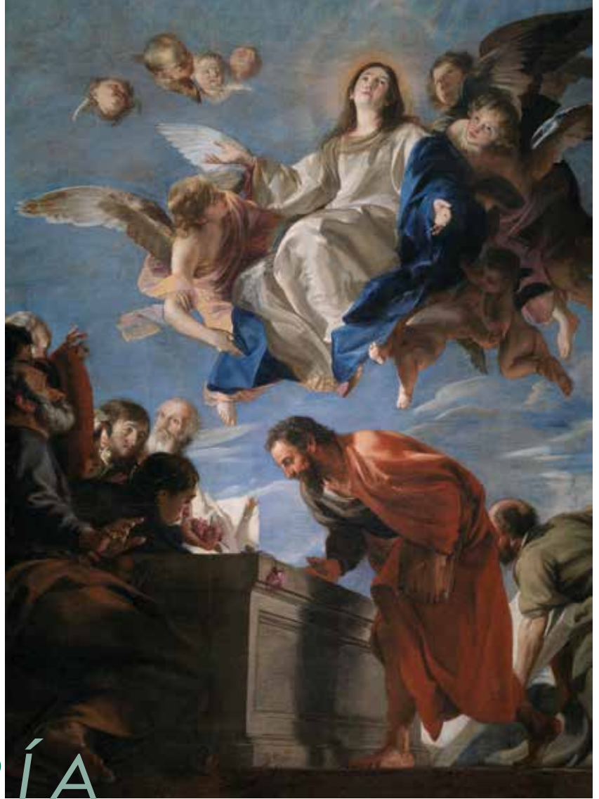
Asunción de la Virgen, Juan Martín Cabezalero, Museo del Prado