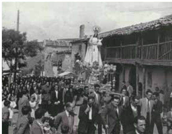
Fiesta patronal Años 60, Virgen de La Rosa, Beteta (Cuenca)

Las Fiestas Patronales, en particular, son momentos de rica vivencia familiar y social, y de expresión de Fe.